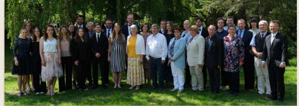
Ein Großteil des Teams - aber nicht alle...

Die Aufgaben der Gemeinde sind in zehn Teams gebündelt. In diesen sollen sich alle Bereiche der Gemeindegemeinschaft wiederfinden. Jedes Team hat zwei bzw. drei Ansprechpartner*innen.