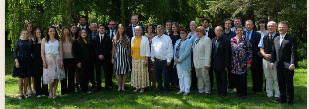
Ein Großteil des Teams - aber nicht alle...

Die Aufgaben der Gemeinde sind in zehn Teams gebündelt. In diesen sollen sich alle Bereiche der Gemeindegemeinschaft wiederfinden. Jedes Team hat zwei bzw. drei Ansprechpartner*innen.